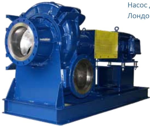
Насос для перекачки сусл. Лондон (Ontario, CAN) I16K-SS