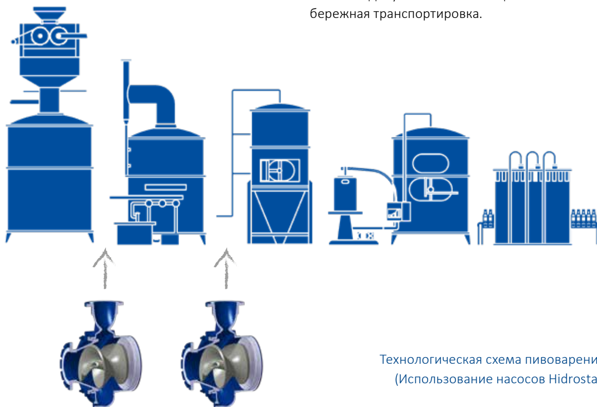
Технологическая схема пивоварения (Использование насосов Hidrostal)

Положительное влияние на качество напитка на всех этапах производственного процесса оказывают низкие значения допустимого кавитационного запаса, а также бережная транспортировка.