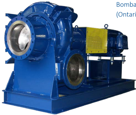
Bomba de (Ontario, CAN) I16K-SS